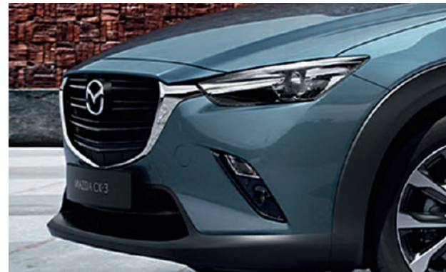
Markante Kühlergrill-Applikationen in Schwarz