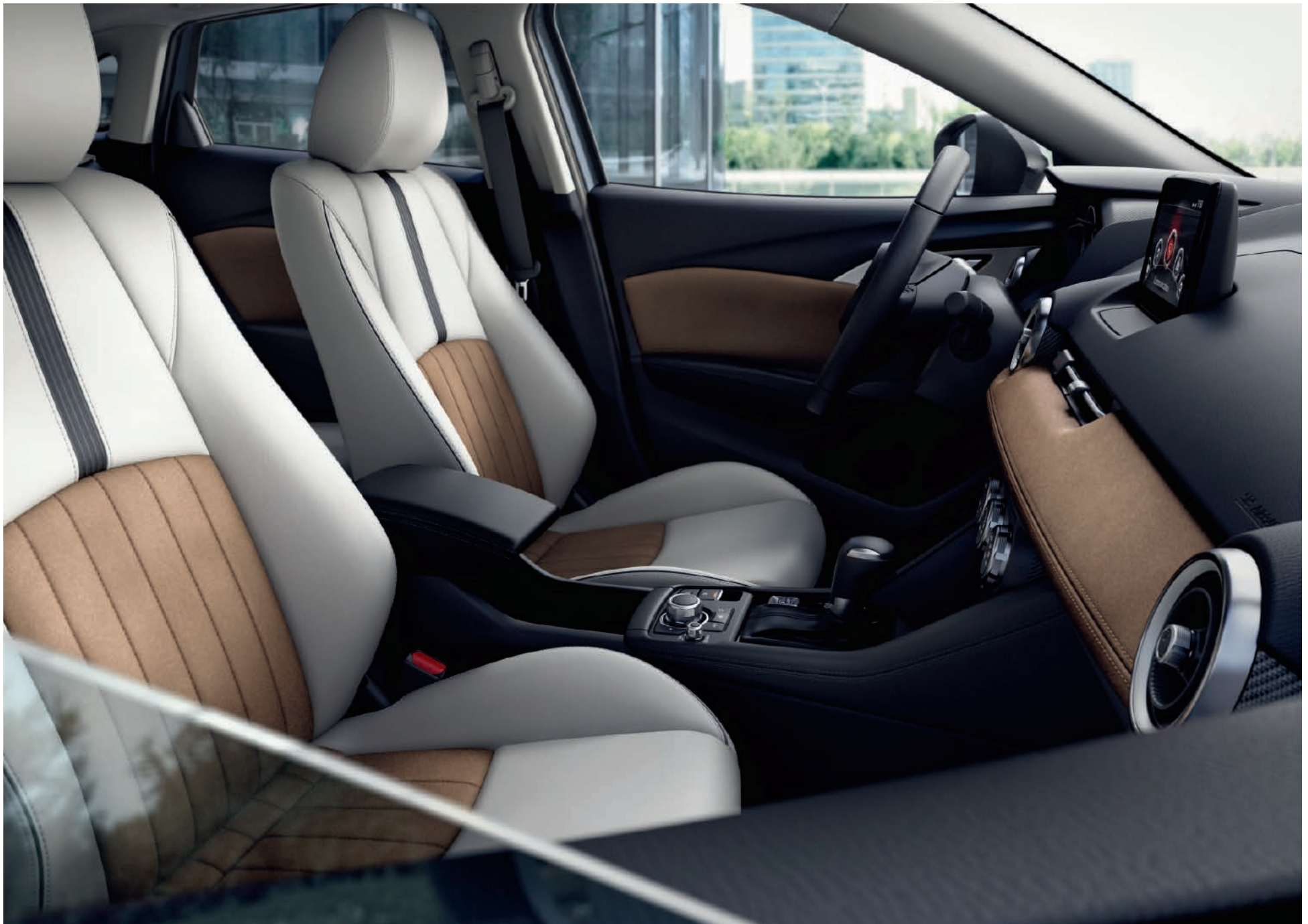
Der exklusive Innenraum mit Sitzbezügen aus weißer Ledernachbildung und braunen Highlights.