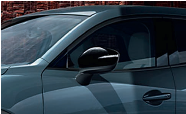
Sportliche Außenspiegelkappen in Schwarz

Profitieren Sie jetzt außerdem vom attraktiven Kundenvorteil in Höhe von 400,- €.